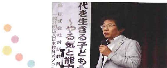
「みんなでコラボ in 中丹」