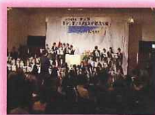
宇治市青少年健全育成推進大会