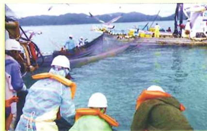
▲チャレンジ漁業体験(10月実施)