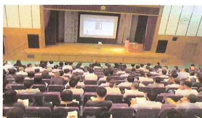
「いじめ・非行防止フォーラム(丹後)」