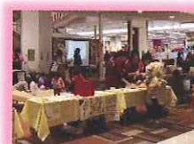
こどもつながりフェスタ in 京都