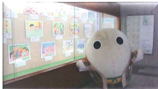
♥入賞作品展示風景(京都府庁会場) *市町村民会議等の協力を得て 19会場で開催