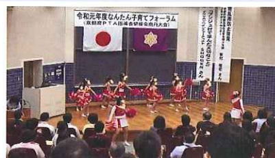
「なんたん子育てフォーラム」