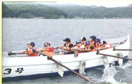
▲カッター体験と野外炊事(8月実施)

昨年度は、夏季から冬季にかけて海にちなんだ事業や、家族単位での事業のほか、施設の無料公開なども行いました。