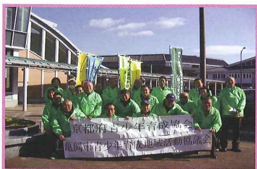
《街頭啓発活動》♪2020年京都スタジアムをバックに♪