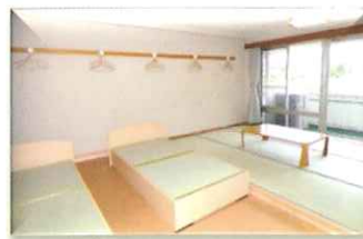
▲リーダー室(定員5名)5室