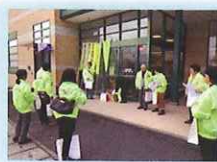
与謝野町青少年育成会 街頭啓発活動

第4回こどもつながりフェスタ in 京都 (11/9 (土)) 第38回宇治市「中学生の主張」大会 (11/9 (土)) 第18回おもしろいやか木幡 (11/10 (日)) 非行少年等立ち直り支援ネットワーク推進連絡会議 (11/13 (水)) 向日市まつりでの街頭啓発活動 (11/16 (土)) 社会教育活動実践交流フォーラム 令和元年度京都府社会教育研究大会 (11/22 (金)) 京都府支部創立130周年記念京都府赤十字大会 (11/22 (金)) 亀岡市青少年育成地域活動協議会街頭啓発活動 (1/13 (月・祝)) 第39回久御山町青少年の主張発表会 (1/18 (土)) 第36回綴喜青少年の主張大会 (1/26 (日)) 令和元年度城陽市青少年健全育成市民会議新年研修会 (1/26 (日)) 40周年記念 第37回宇治市青少年健全育成推進大会 (1/26 (日)) ガールスカウトフェスタ (2/11 (火・祝)) 第27回相楽「少年の主張」大会 (2/17 (日))