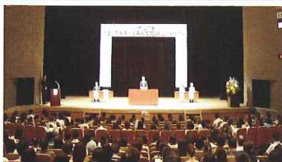
「やましろ未来っ子みんなで HUG フォーラム」