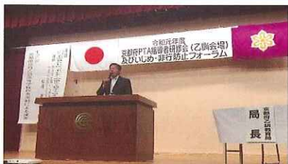
「いじめ・非行防止フォーラム(乙訓)」