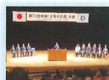
相楽「少年の主張」大会